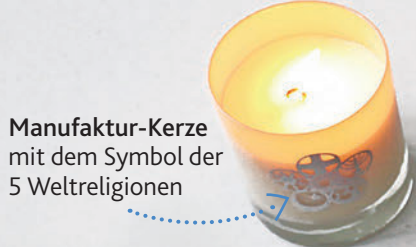
Manufaktur-Kerze mit dem Symbol der 5 Weltreligionen