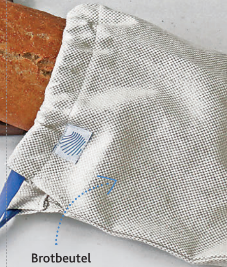
Brotbeutel aus Leinen/Baumwolle

Sorgfältig ausgewählt, ökologisch, minimalistisch, individuell, zeitlos, fair, regional, handgemacht, authentisch – im Hofladen am Benediktushof finden sich besondere Geschenkideen, ausgesuchte Naturkostprodukte, kleine Mitbringsel und hofeigenen Produkte.