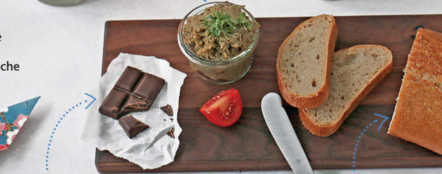
Naturkost wie Bio-Schoki