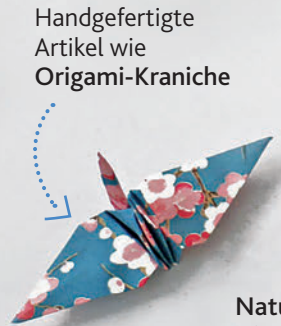
Handgefertigte Artikel wie Origami-Kraniche